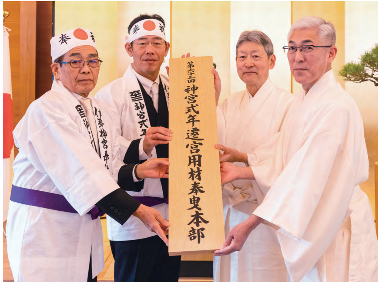
左より(敬称略) 奉曳本部長(伊勢商工会議所会頭) 山野稔、奉曳本部長(伊勢市長) 鈴木健一、神宮大宮司 久邇朝尊、神宮少宮司 齊藤郁雄