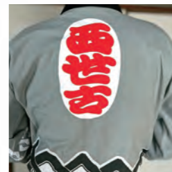
常磐西世古奉曳団