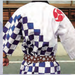
一之木町須原奉曳団