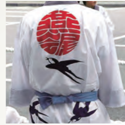
二俣町奉曳団・燕尾会