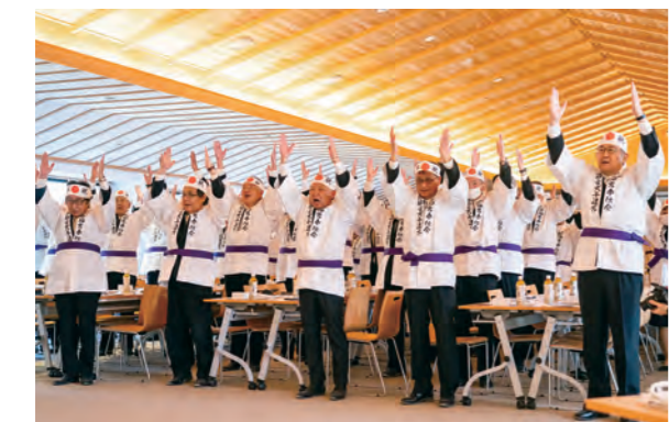
内宮参集殿での奉曳本部結成式の締めくくり 出席者一同による万歳三唱

第六十三回神宮式年遷宮 お木曳行事 令和7年 6月8日~10日 御樋代木奉迎奉曳行事 令和8年 4月中旬 御木曳初式(役木曳) 令和8年 5月上旬~8月上旬 第一次お木曳行事 令和9年 5月上旬~8月上旬 第二次お木曳行事 *社会情勢等により変更となる場合があります