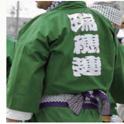
西口町瑞穂連奉曳団