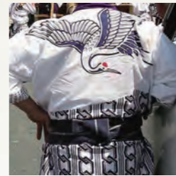
徳川山鶴亀会奉曳団