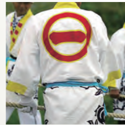
黒瀬町橘栄社奉曳団