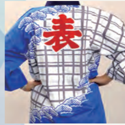
常磐表町筋向橋連奉曳団