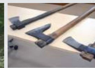
工程によって使い分けられる斧