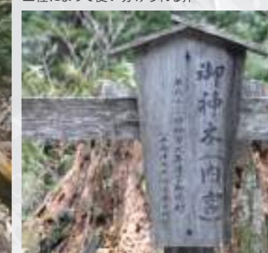
裏木曾国有林。御神木の切り株

木曾・裏木曾の御神山では、伐採された切り株に梢を立て、木霊に対し感謝の意を表す鳥総立ての儀式が行われてきました。大自然の森の恵みに感謝し、この先においてもこの恵みが受け継がれていく事を、地域の人々は祈っています。