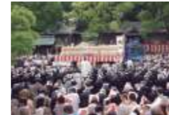
堤治神社【一宮市】(平成17年6月7日)