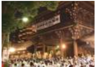
真清田神社【一宮市】(平成17年6月7日)