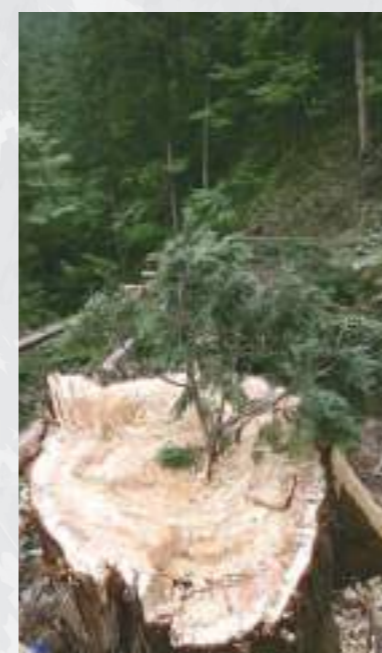
裏木曾御用材伐採式 鳥総(とぶさ)立て(平成17年6月5日)