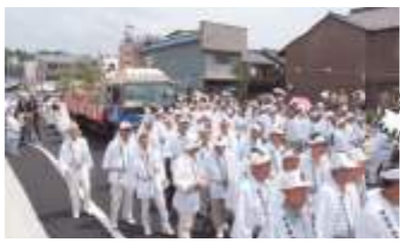
瑞浪市内を奉搬(平成17年6月7日)