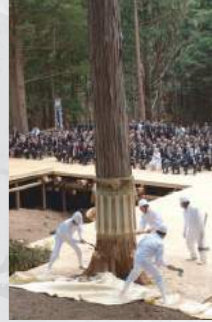
御神山祭(平成17年6月3日)

【長野県上松町(木曾)】 神宮式年遷宮で、御神体をお納めする「御樋代」となる御神木を伐り出すお祭りが御神山祭です。前回は平成17年6月3日に、長野県上松町で斎行されました。御神山にて、厳しい条件を満たした左右に並ぶ二本の檜が選ばれ、杉木の音が響く中「三ツ緒伐り」の作法で伐り出しました。