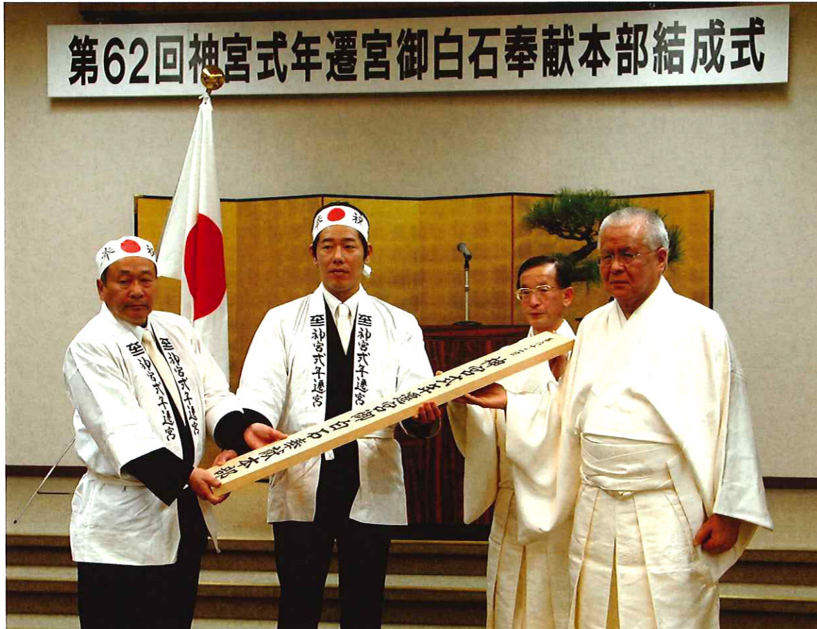
第62回神宮式年遷宮御白石奉獻本部結成式

編集発行・御遷宮対策委員会 伊勢市岩淵1-7-17(伊勢商工会議所内) 電話0596-25-5215