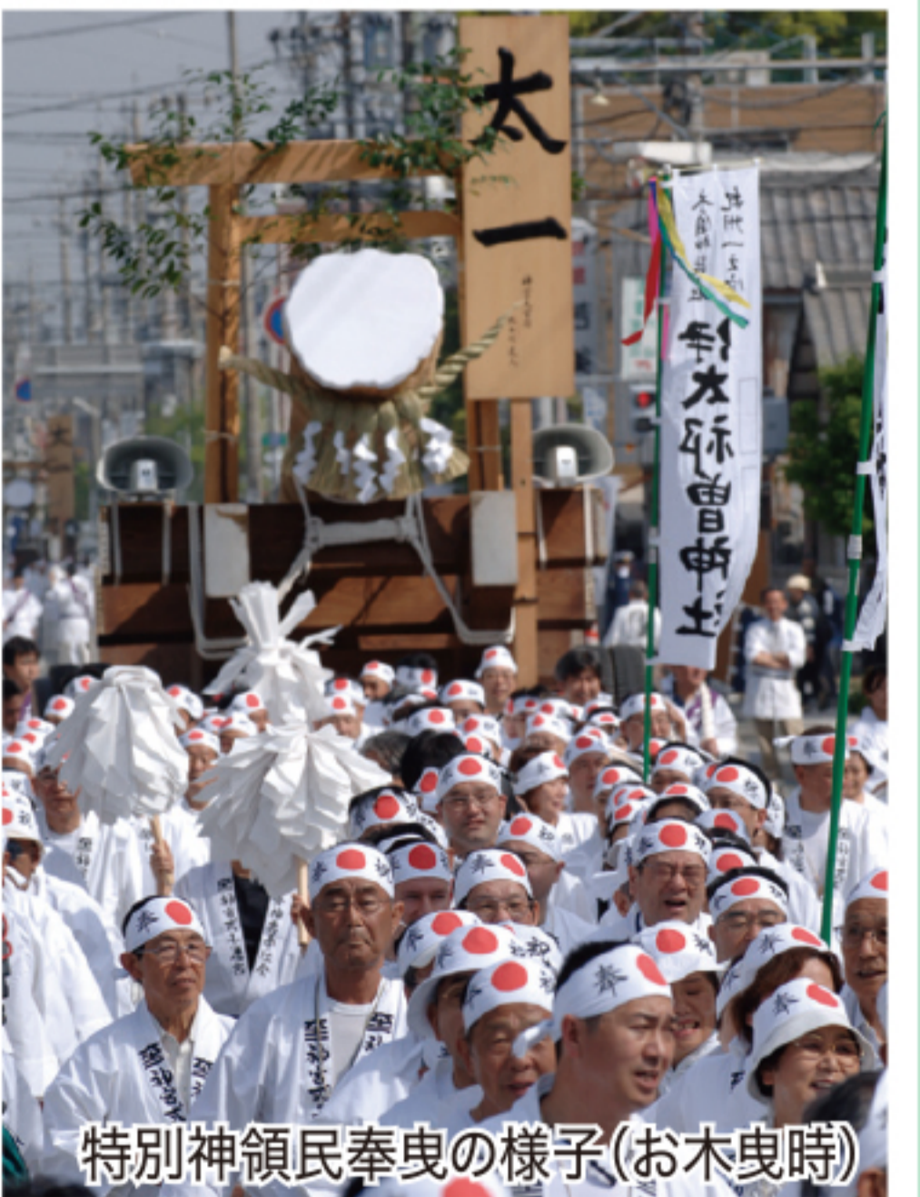
特別神領民奉曳の様子(お木曳時)

昭和 48 年から始まった全国の神社関係者、伊勢神宮崇敬者にもご奉仕していただく特別神領民制度。地元神領民同様に奉曳車にてお白石を内宮・外宮前まで奉曳し、おひとりずつお白石を新宮に奉獻していただきます。