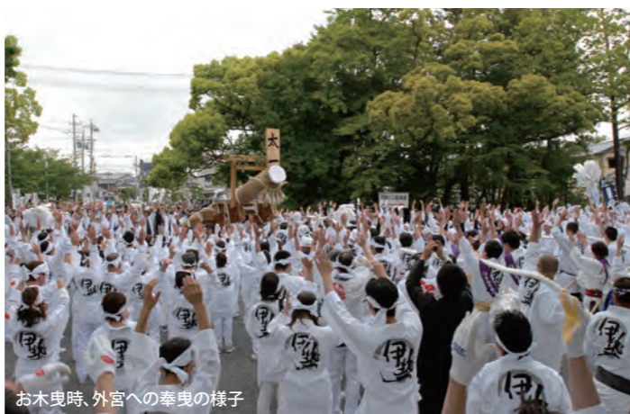
お木曳時、外宮への奉曳の様子