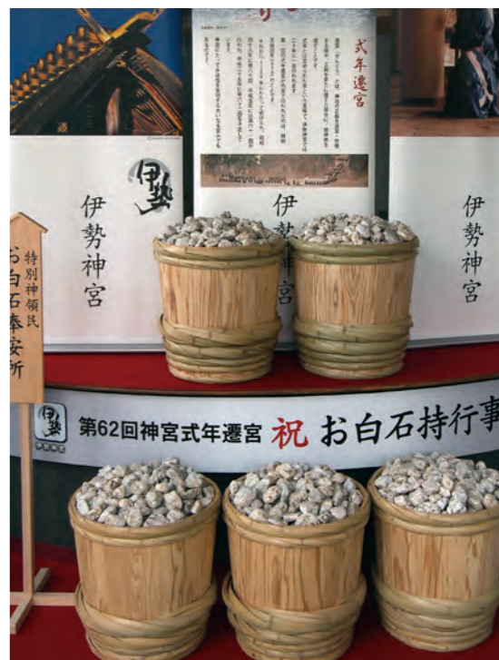
お白石、ただ今展示中（伊勢商工会議所ロビー）

お白石持の歴史は、50年以上前に遡るとされていますが、明治期には伊勢市・度会町の宮川でお白石を採拾し、町々（神領）の団が奉獻することが連の行事として行われていた記録が残っています。一度のご遷宮で十萬個を超えるお白石が必要ですから、その準備もおろそかにはできません。一年前にしてすでに数が整った団もあれば、これからがお白石拾いの本番！というところも…。各団それぞれ苦勞をされ、お白石を準備していただいていることと思います。 御遷宮対策委員会としても昨年より事業の環として、多くの皆様にご協力をいただきながらお白石拾いを実施しております。 5月某日には、度会町田間地区に石拾いに出掛けました。この日は約80名が広い河原を三々五々、ほどよい大きさのお白石を探して歩き、拾っ