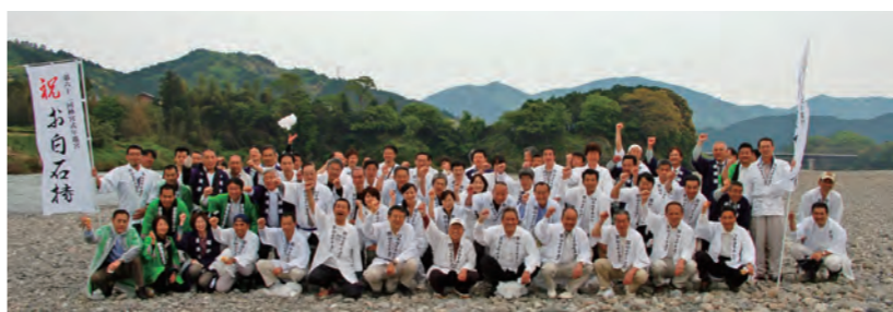
御遷宮対策委員会では市役所、観光協会、商工会議所が合同でお白石拾いを実施。