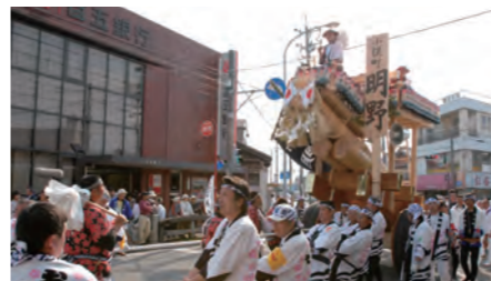
陸曳 / 小俣町奉曳団明野分団 (筋向橋周辺) ※写真は第62回神宮式年遷宮お木曳行事「奉曳」の様子 / 平成18年

曳くという字を「えい」と音読みするわけですが、お木曳だと「ひき」と訓読みで濁らないのに「川曳」「陸曳」は「びき」となる。これが初心者にはなかなか難しいようです。全国からのお客様を迎えることも多い自慢の民俗行事、うまく説明したいですね。