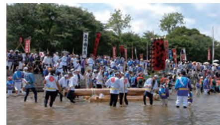
川曳 / 二見町江清渚連 (五十鈴川)