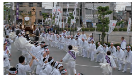
陸曳 / 「太一」の札が付いた神宮の奉曳車 (外宮北御門)