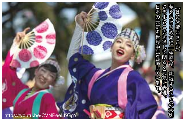
【ほにや流よさこい】 夢をあきらめずに一生懸命、挑戦することの大切さをよさこいを通して明るく元気に表現。日本の元気を世界中に発信しています。

「レトロモダン」 踊る人と見る人が一緒に創る、よさこいを創りたいと生まれたほにや流よさこい。 皆さまに支えていただき二十六回目の年に、高知よさこい祭りで二年連続、8度目の「よさこい大賞」を受賞いたしました。これも皆さまの、温かいご声援のおかげと心より感謝しております。 これからも土佐の宝、よさこい祭りの素晴らしさを伝え、つないでまいり思っています。 「ほにや流よさこい」を、ぜひ一緒に楽しみてください。 さあさあみなさん一緒に「踊らにやそんそん」