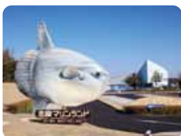
志摩マリンランド