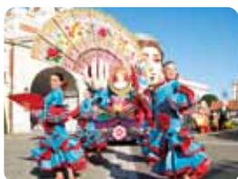
志摩スペイン村 バルケエスパーニャ