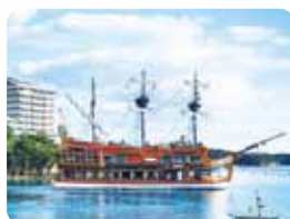
賢島エスパーニャクルーズ